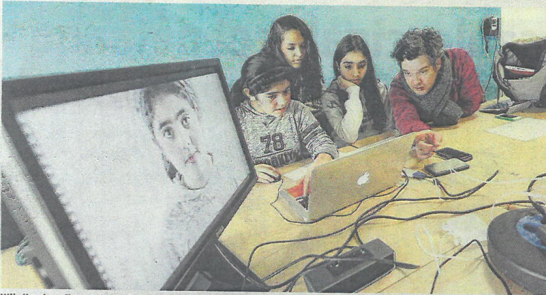
Wil, l'artiste flamand, a lui même appris le français « sur le trottoir de Bruxelles et avec ses petites amies francophones ». Son rêve ? Qu'un de ses « élèves » fasse du cinéma son métier.