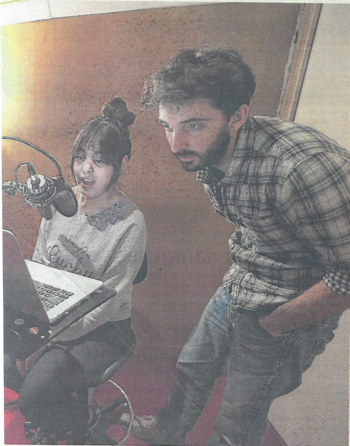
Encadrés notamment par la metteur en scène et auteur Charlotte Lagrange, les ados du lycée de Montbéliard créent un feuilleton radiophonique qui se conclura par une déambulation audioguidée (« Sédiments ») dans les rues de Montbéliard en mai.