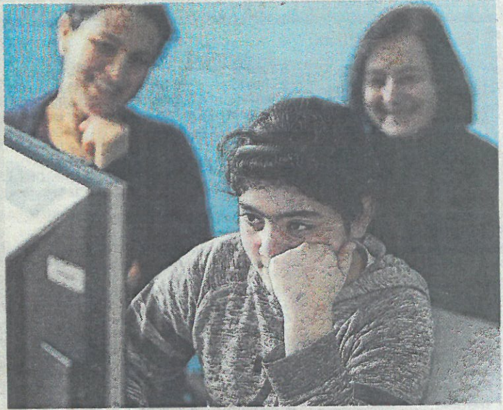
À Lou-Blazer, certains enfants témoignent face caméras, d'autres ont tourné des documentaires, par exemple aux Restos du cœur.